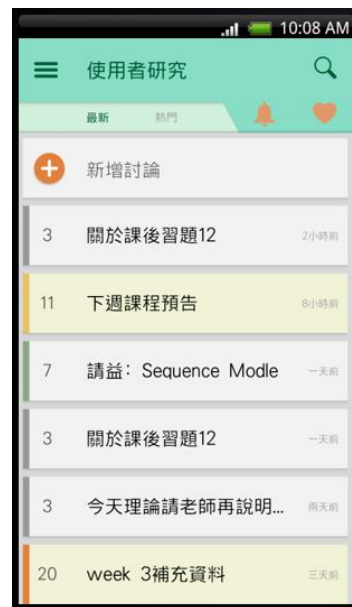
圖五、課程討論總覽